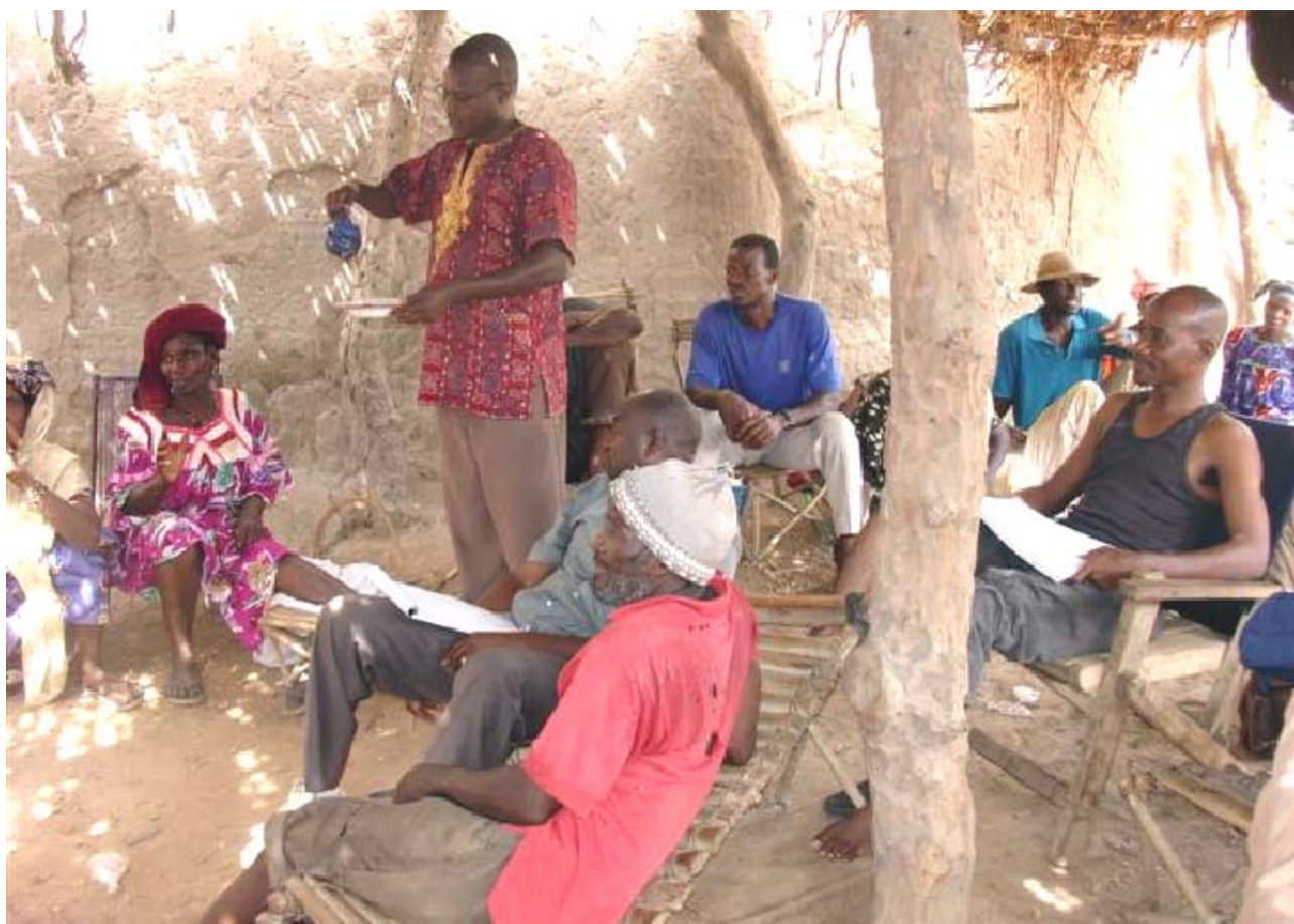
Etablir des passerelles entre les utilisateurs de ressources naturelles et les forestiers