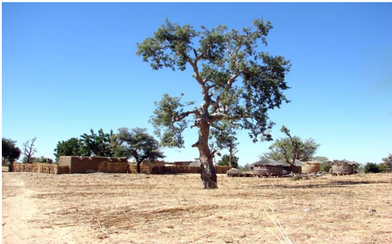
Parcs agroforestiers dégradés comme conséquence de l'inadéquation entre loi et actions de régénération des espèces locales

Au Niger, par contre, l'Etat a surmonté ce hiatus en transférant l'accès, l'utilisation et la gestion des agroforêts aux populations rurales. Il reconnaît aussi l'utilisation d'arrangements locaux de même qu'il implique les utilisateurs de ressources naturelles dans la gestion des arbres. Le gouvernement du Niger a promu « les contrats de culture » dans les aires protégées. Les utilisateurs de ressources naturelles sont encouragés à planter des arbres produisant du bois d'œuvre, du bois de chauffe et aussi pour des finalités écologiques. Les espèces locales d'arbres protégés ne sont pas strictement contrôlées sur les champs mais les utilisateurs de ressources naturelles sont sensibilisés à leur utilisation durable de même qu'un contrôle et un système d'évaluation sont en place pour veiller à leur utilisation durable. Le cas Nigérien a été couronné de succès parce que les arrangements locaux ont été employés pour contrôler l'utilisation des arbres.